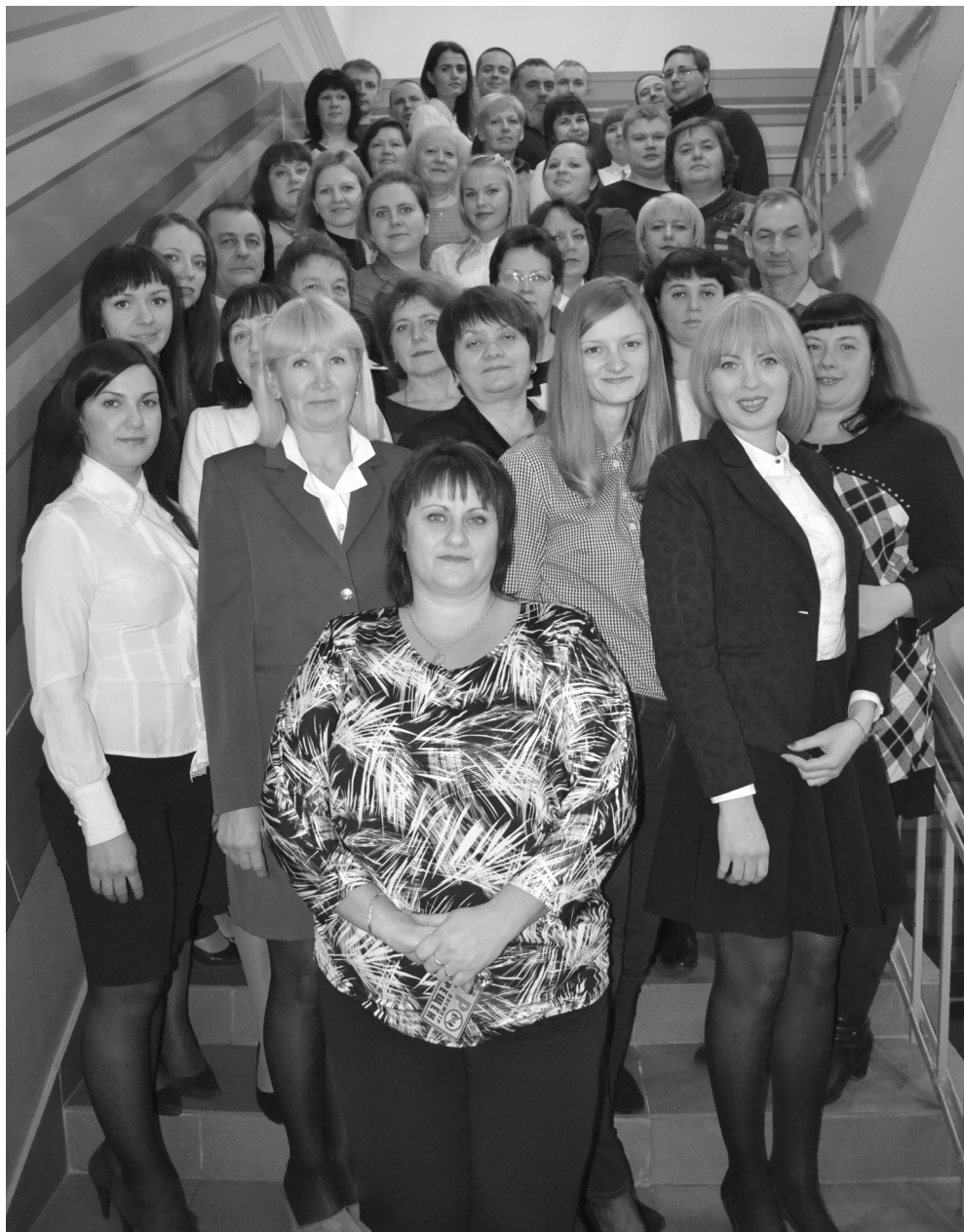
Коллектив Межрайонной ИФНС России № 6 по Смоленской области

Коллектив Межрайонной ИФНС России №6 по Смоленс-