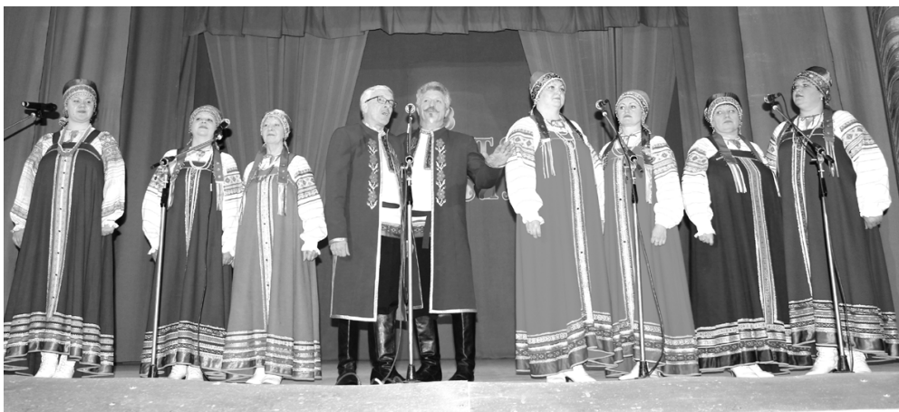
Ансамбль народной песни «Родники»