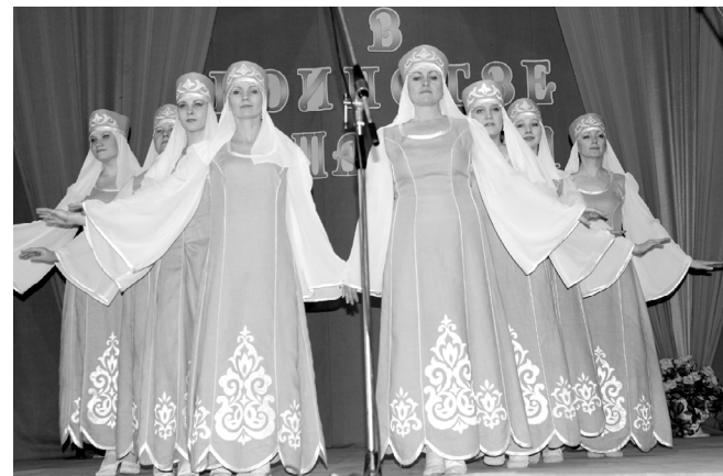
Взрослая группа хореографического коллектива «Вдохновение»