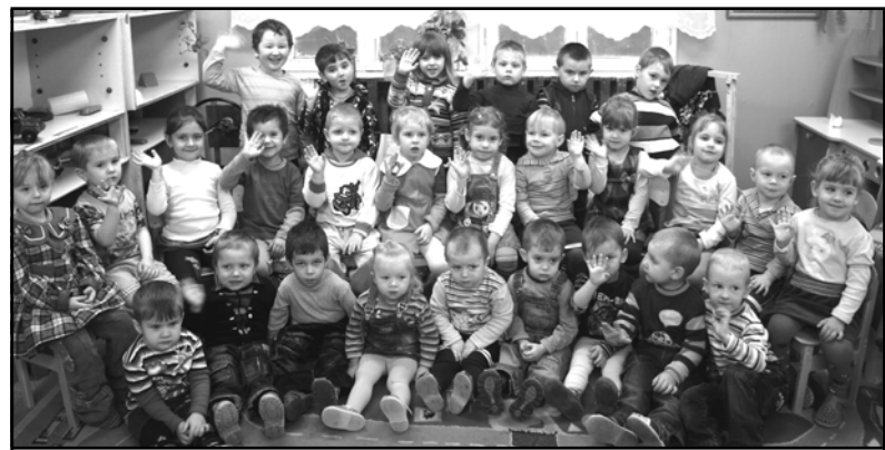
На снимке: воспитанники средней и младшей групп детского сада «Родничок».

Губернатор Смоленской области А.В. ОСТРОВСКИЙ.