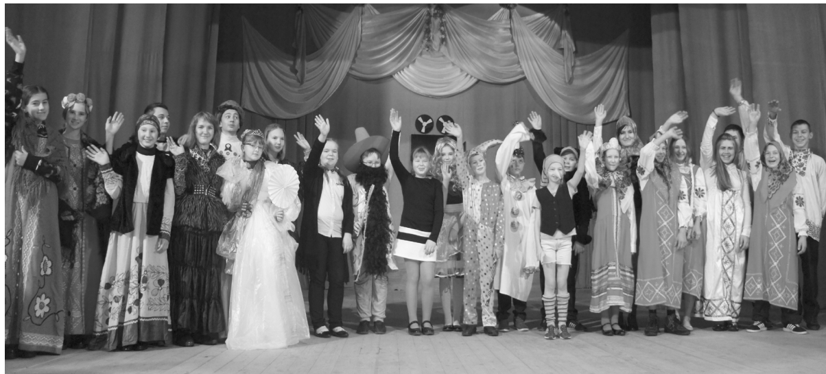
Участники фестиваля. Фото на память

В ноябре в рамках празднования года Российского кино в районном Доме культуры прошел фестиваль детского творчества «Фильм, фильм, фильм ...». Его организатором выступил Центр воспитательной работы и детского творчества. Творческие коллективы из Гусинской, Глубокинской и Красновской средних школ привезли на фестиваль свои версии художественных фильмов.