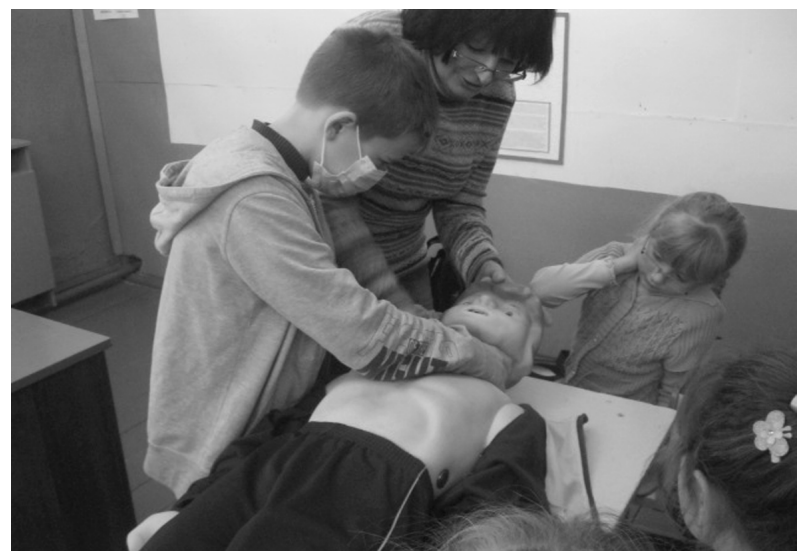
Ребята учатся оказывать первую помощь пострадавшему