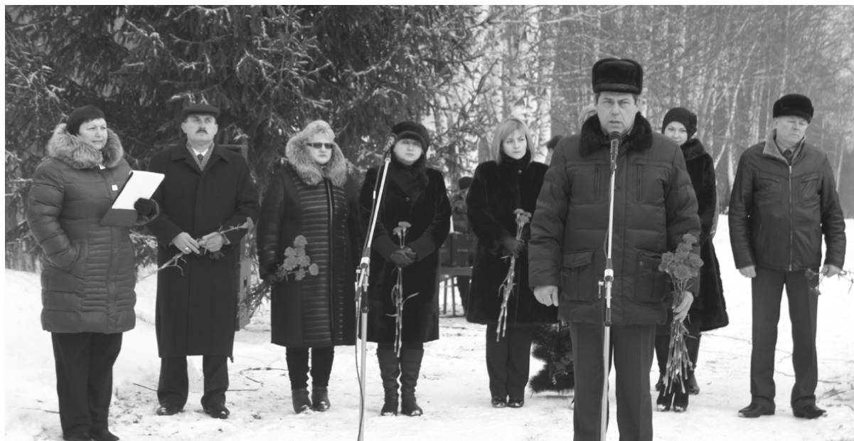
Идет торжественно-траурный митинг

2 декабря накануне Дня Неизвестного солдата, установленного в память о доблести безымянных воинов, павших при защите Родины в годы Великой Отечественной войны, а также в других войнах и конфликтах, на Нулевой версте Старой Смоленской дороги на Поле Памяти у Памятного знака Неизвестному Солдату прошел траурно-торжественный митинг