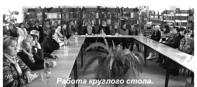
Работа круглого стола.

В рамках сотрудничества Краснинского района с Дубровенским районом Республики Беларусь 4 апреля мы принимали гостей-работников культуры и библиотечной системы, музейных работников. Сотрудники Краснинского краеведческого музея провели гостям района экскурсии по памятным местам Отечественной войны 1812 года. После знакомства с местными достопримечатель-